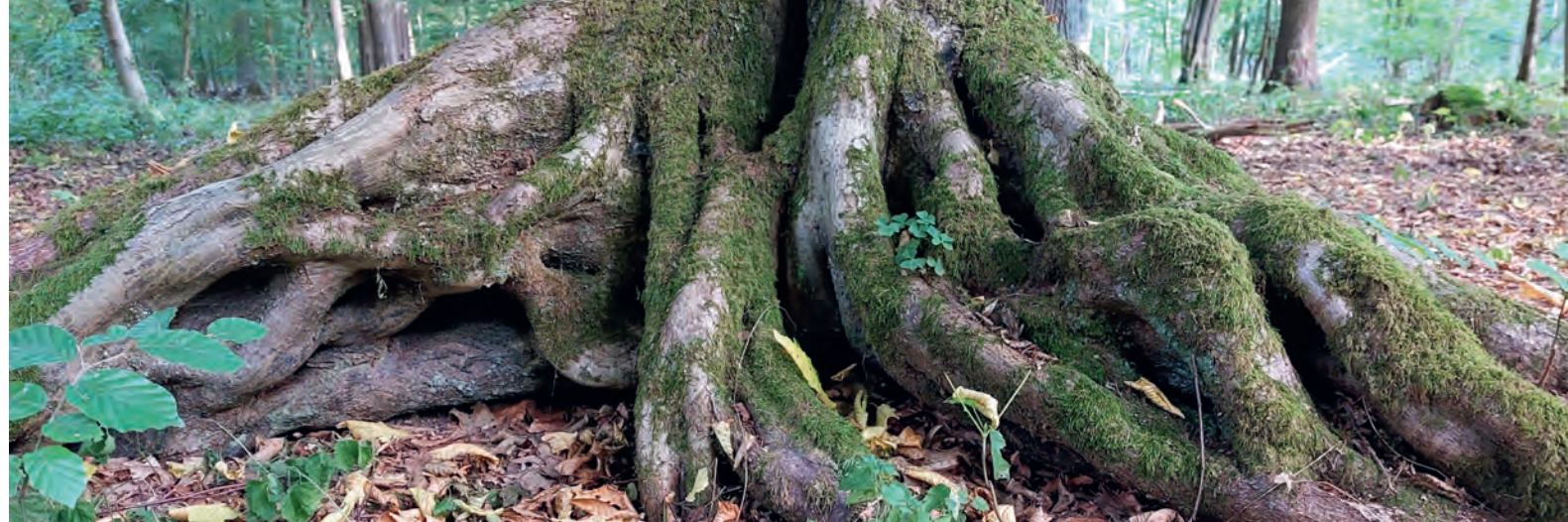
Stamfuß einer alten Hainbuche mit ausgeprägten Mikrohabitatstrukturen in Lippetal.

Wald und Holz NRW verfolgt konsequent das Prinzip der Nachhaltigkeit: Es wird grundsätzlich nicht mehr Holz eingeschlagen als nachwächst. Die schweren Schäden der vergangenen Jahre lassen auf Forstamts-ebene zurzeit keine konkreten Angaben zum Holzzuwachs zu. Die neue Landeswaldinventur wird hierzu Daten liefern.